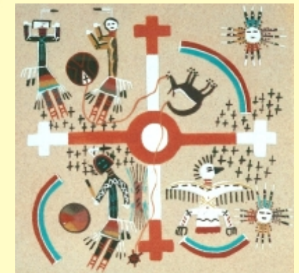
ein Sandbild der Navajo-Indianer