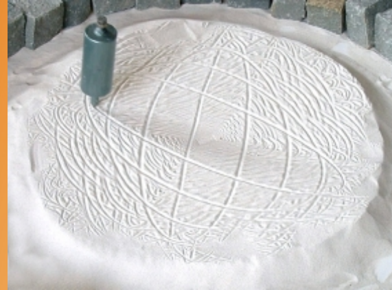
ein Pendel hat Linien in eine Schicht aus weißem Quarzsand gezeichnet