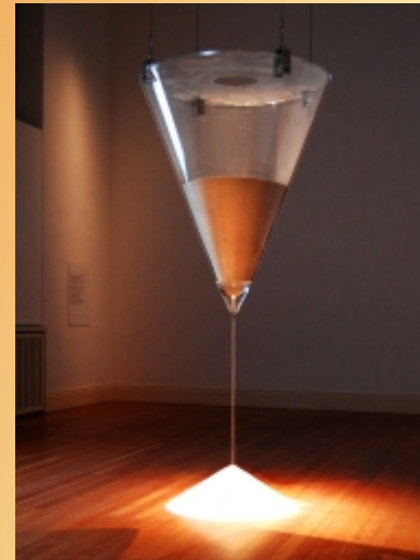
eine 2 Meter hohe Sanduhr, die den ganzen Tag Sand auf den Boden streut